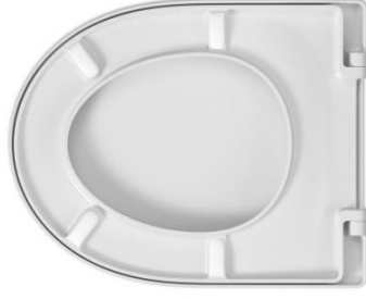
2 Deckelpuffer DP97 4 Sitzpuffer SPQ2