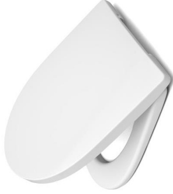
Öffnungswinkel > 110°