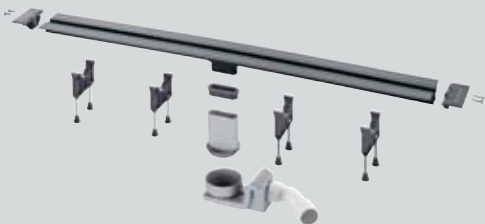
Advantix Vario Grundkörper Modell 4965.10