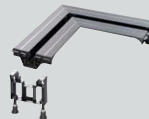
Verbindungsstück Ecke Modell 4965.14