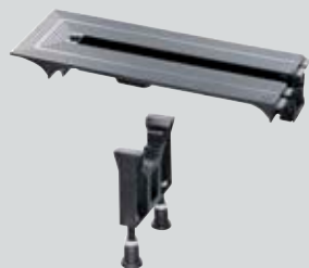
Endverschlussstück Modell 4965.16