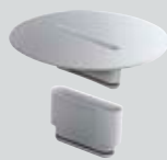
Entnahme-Werkzeug Modell 4965.90