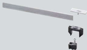
Stegrost 20 cm* Modell 4965.60, 4965.61, 4965.62, 4965.63