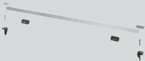
Advantix Stegrost, 30–120 cm* Modelle 4965.30, 4965.31, 4965.32, 4965.33