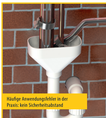
Häufige Anwendungsfehler in der Praxis: kein Sicherheitsabstand