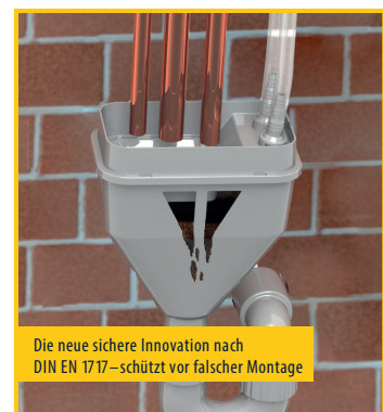
Die neue sichere Innovation nach DIN EN 1717 – schützt vor falscher Montage