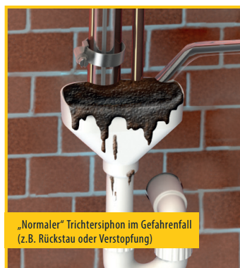
„Normaler“ Trichtersiphon im Gefahrenfall (z.B. Rückstau oder Verstopfung)