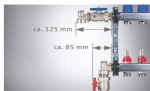
Verteiler-Anschluss-Set 90° (Art.-Nr. 291100)