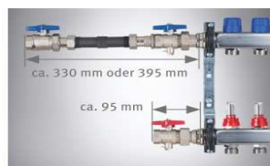
WMZ-Anschluss-Set Durchgang (Art.-Nr. 721017 oder 721027)