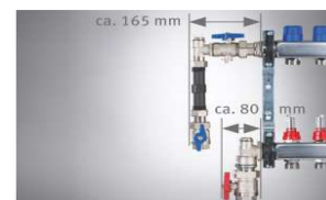
WMZ-Anschluss-Set 90° (Art.-Nr. 721037 oder 721047)