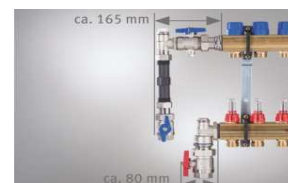
WMZ-Anschluss-Set 90° (Art.-Nr. 721037 oder 721047)