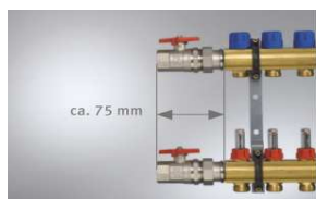
Kugelhahn-Set Durchgang (Art.-Nr. 295100)

Folgende Kombinationen sind möglich und jeweils als Set separat zu bestellen: