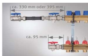
WMZ-Anschluss-Set Durchgang (Art.-Nr. 721017 oder 721027)