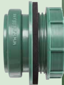
Anschraub-Muffe DN 50 - grün