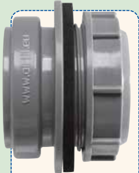
Anschraub-Muffe DN 50 - grau

Airfit Anschraub-Muffe DN 50 zum nachträglichen Anschluss von HT-Reinigungen ab DN 75 aufwärts zum Einleiten von Abwässern aus Brennwertgeräten, Spülen, Waschmaschinen, usw.